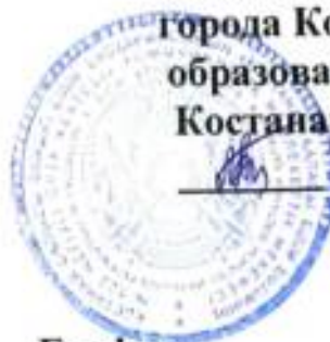
График проведения консультаций 4-9 классов по подготовке к мониторингу образовательных достижений обучающихся в 2025-2026 учебном году